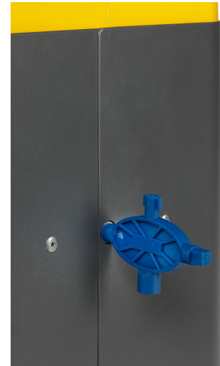
Abb.: Artikel 2161

Aufsatz smaragdgrün (RAL 6001) beschichtet, Piktogramm Restmüll