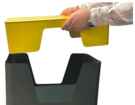
Abb.: Artikel 2161