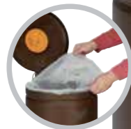
Art.-Nr.: 1130 (70l-Sack)

Passende Abfallsäcke finden Sie auf S.04