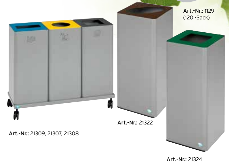
Art.-Nr.: 21309, 21307, 21308