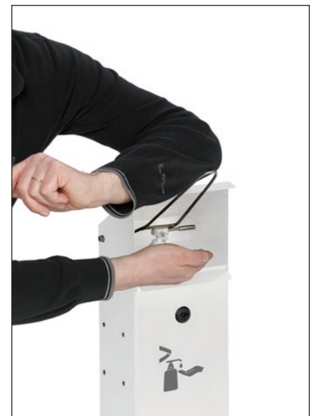
Abb.: Artikel 2052