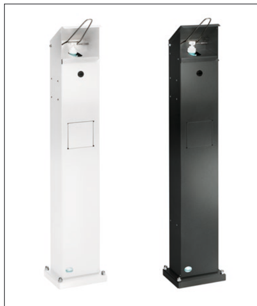
Abb.: Artikel 2051