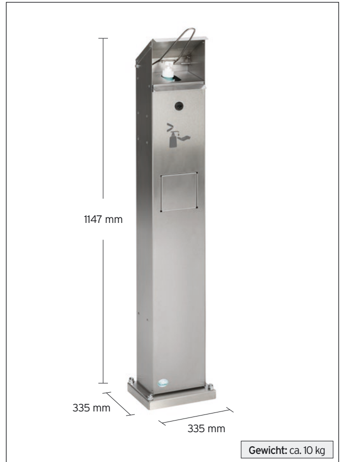
Abb.: Artikel 2050

Flasche und Pumpe sind im Lieferumfang enthalten.