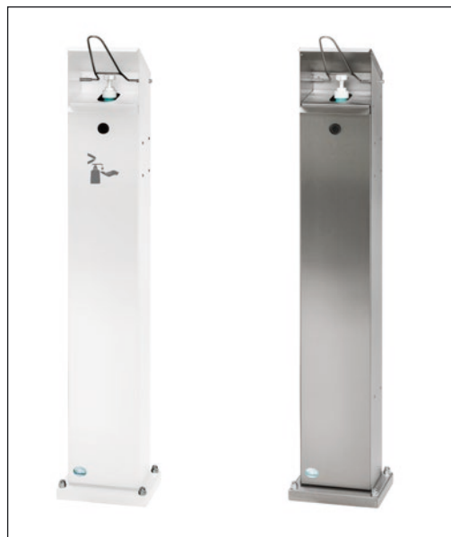
Abb.: Artikel 2061