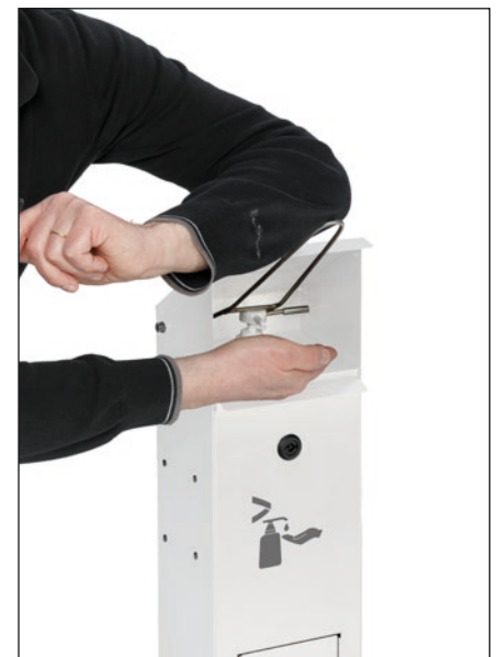
Abb.: Artikel 2060