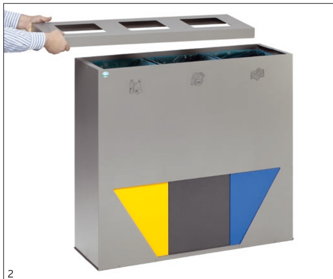
Abb.: Art.-Nr. 21342