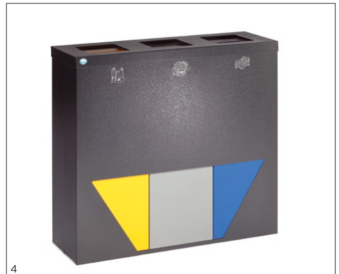
Abb.: Art.-Nr. 21343