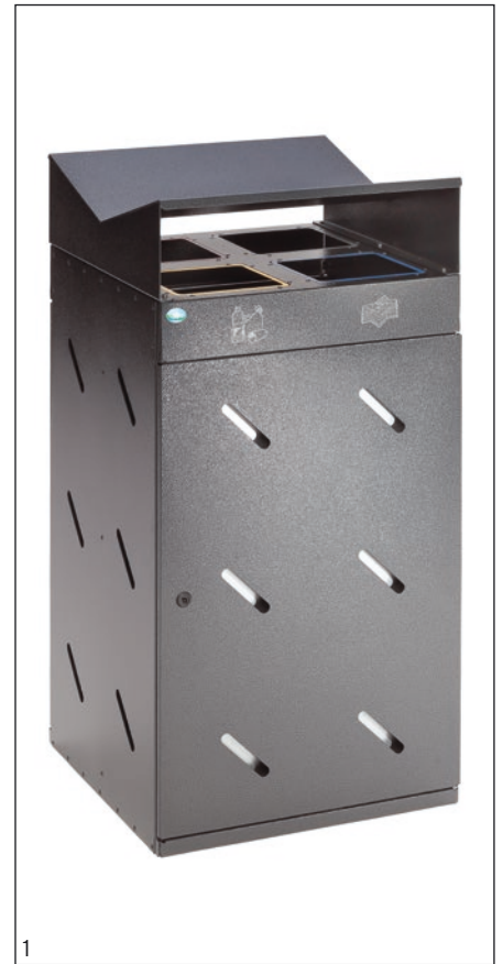
Abb: WS 58 antik-silber (21340)

Inkl. Montagematerial zur Bodenbefestigung.