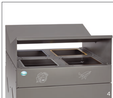
Abb: Einwürfe des WS 58 eisenglimmer (21341)