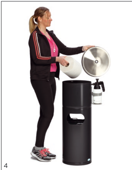
Abb.: Desinfektionsstation Edelstahl, Art.-Nr. 2011