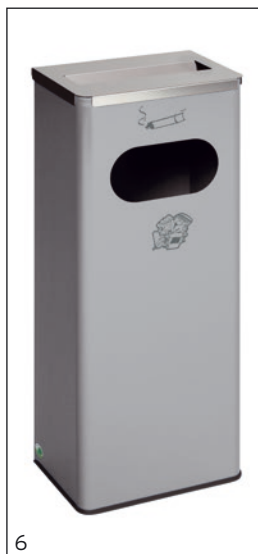
Abb.: Art.-Nr. 28733