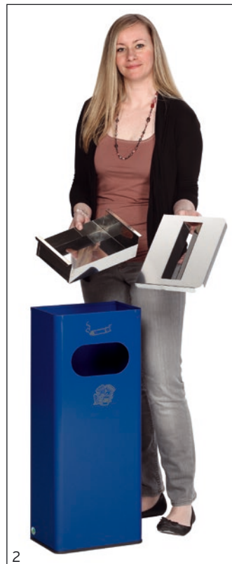
Abb.: Art.-Nr. 28732