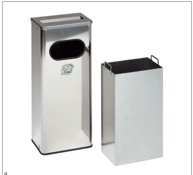
Abb.: Art.-Nr. 28738 und 28739