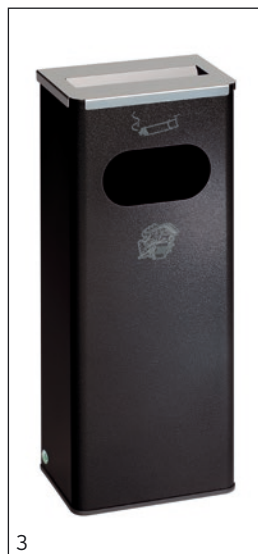
Abb.: Art.-Nr. 28730