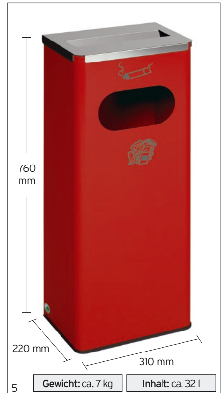
Abb.: Art.-Nr. 28731