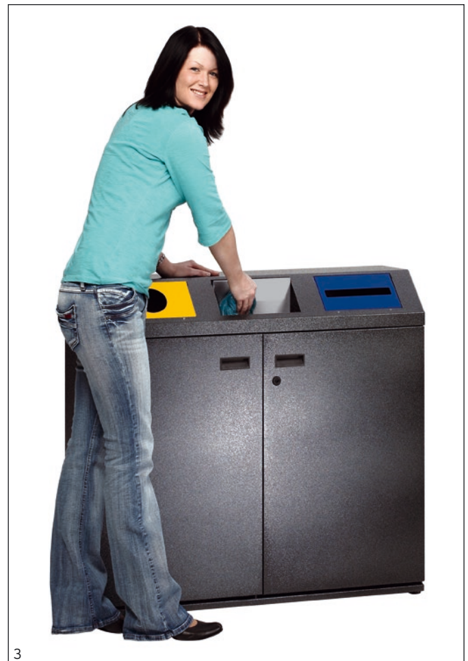
Abb.: Art.-Nr. 21210