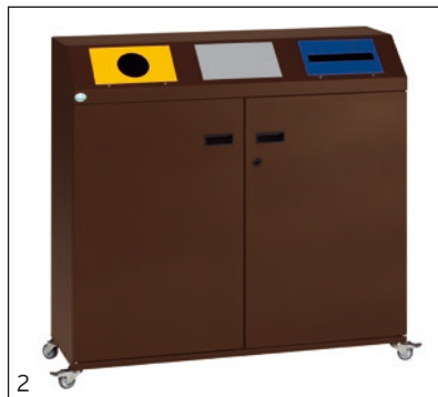
Abb.: Art.-Nr. 21212 und Art.-Nr. 21209