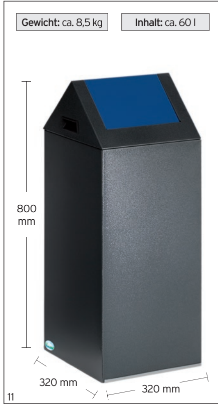
Abb.: WSG 55S, antik-silber, Einwurfklappe enzianblau, Art.-Nr. 21021