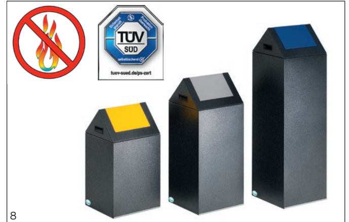
Abb.: WSG 40S, WSG 55S und WSG 85S

Bodenschonender Kantenschutz (Bei antik-silber-Kantenschutz in silber-grau, bei silber-Kantenschutz in schwarz).