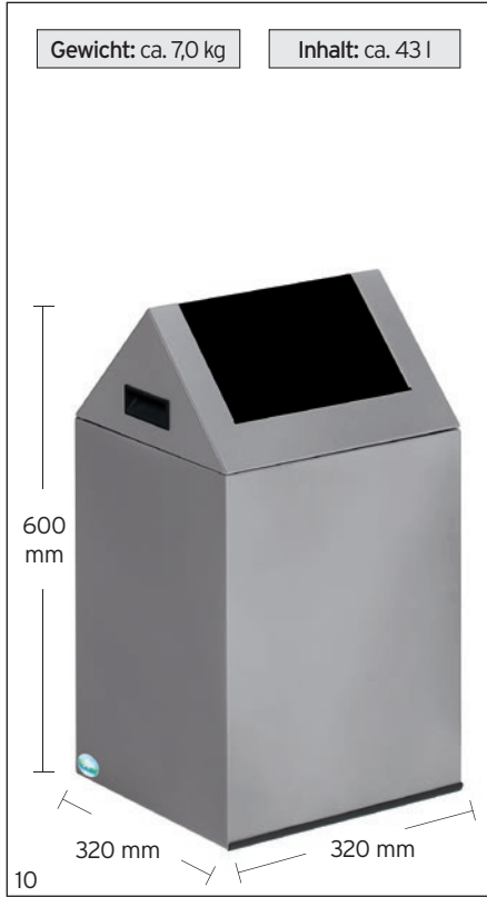
Abb.: WSG 40S, silber, Einwurfklappe anthrazit, Art.-Nr. 21122