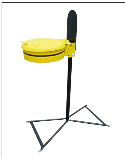
Foto: Standfuß RAL 7021 (10114) mit Piktogrammplatte und Wandgerät mit KS-Deckel gelb (36742)