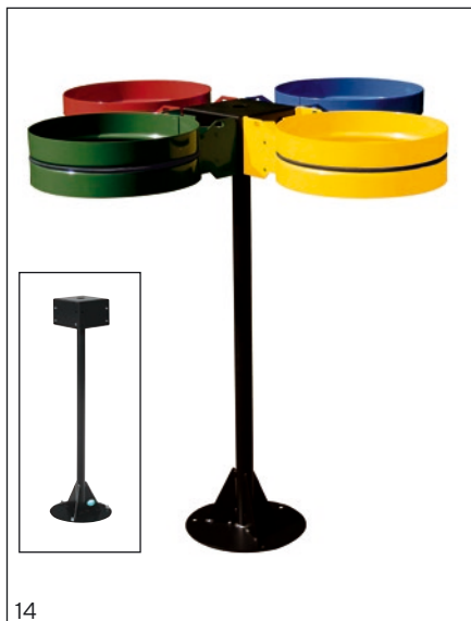
Abb.: Standfuß mit 4 Aufnahmen RAL 7021 (19403) mit 4 Wandgeräten ohne Deckel rot (36739), blau (36736), grün (36733) und gelb (36741)