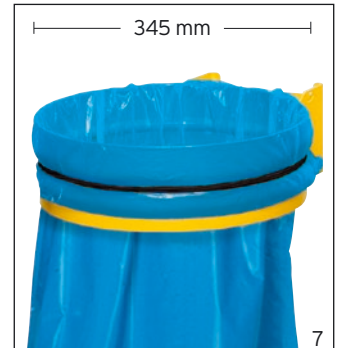
Abb.: Wandgerät ohne Deckel gelb (36741)

Geräte aus Stahlteilen gefertigt. Oberflächenschutz = hochwertige Pulverbeschichtung. Mit Gummiband zur Sackbefestigung. Einfaches und schnelles Wechseln der Abfallsäcke.