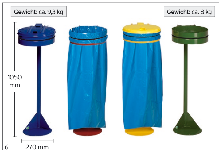
Abb.: Standgerät mit ME-Deckel blau (36712), ohne Deckel rot (36744), mit KS-Deckel gelb (36748), ohne Deckel grün (36746)