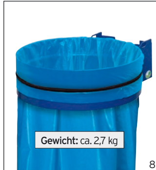
Abb.: Wandgerät ohne Deckel blau (36736)