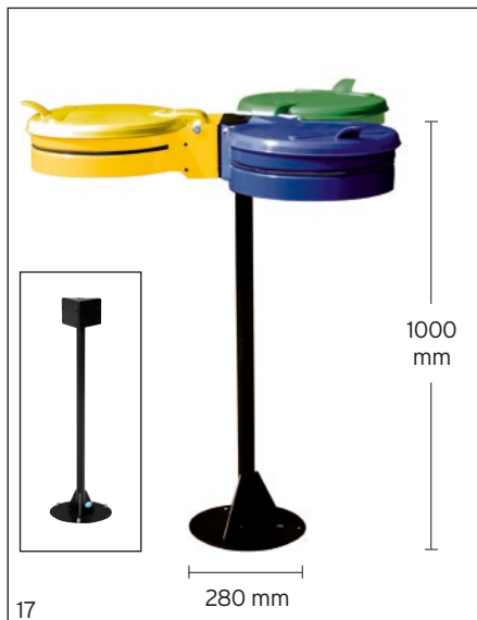
Abb.: Standfuß mit 3 Aufnahmen RAL 7021 (19402), mit drei Wandgeräten gelb (36724) blau (36734) und grün (36731)