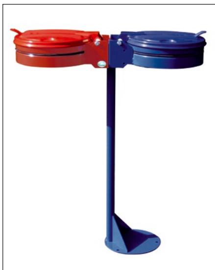
Foto: Standgerät mit KS-Deckel blau (36713) und Wandgerät mit KS-Deckel rot (36737)