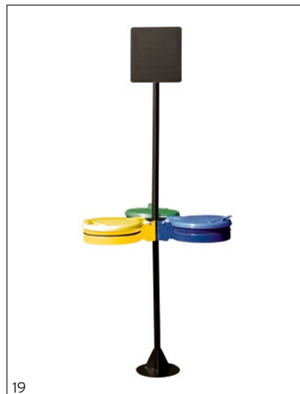
Abb.: Schild mit Rohrverlängerung, anthrazit, RAL 7021 (19404), Standfüße mit 3 Aufnahmen RAL 7021 (19402) und drei Wandgeräten mit KS-Deckeln blau (36734), grün (36731) und gelb (36742)