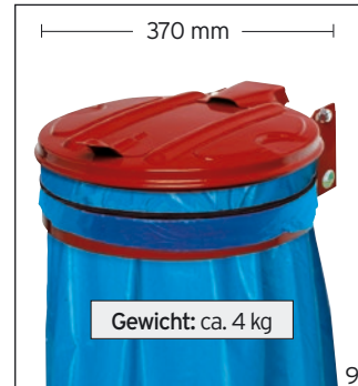
Abb.: Wandgerät mit ME-Deckel rot (36738)