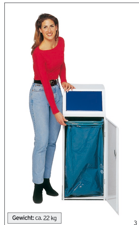
Abb.: WSG 69 mit Fronttür; Ausf. A, Einwurflappe, enzianblau, Art.-Nr. 17152