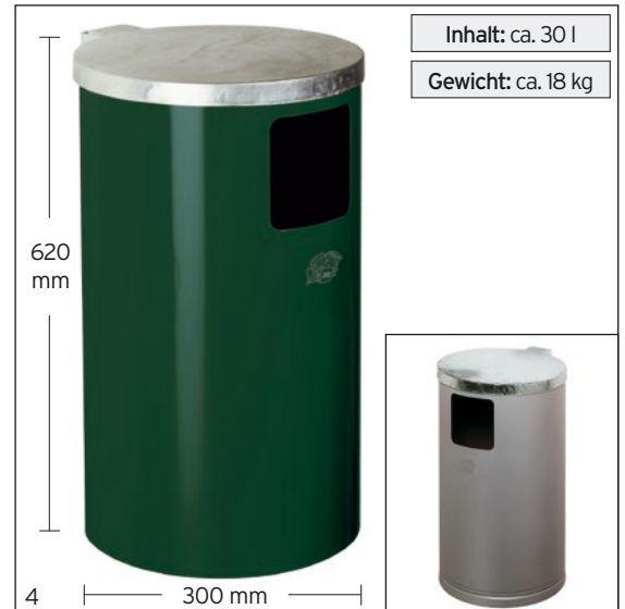
Abb.: WR 1, moosgrün besch., Art.-Nr. 14451 und WR 1, silber besch., Art.-Nr. 14405