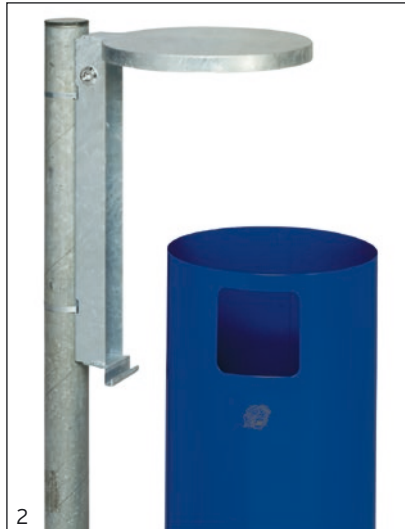
Abb.: WR 1, enzianblau beschichtet, Art.-Nr. 1446, hier mit Standrohr, Art.-Nr. 1449 (Behälter demontiert)