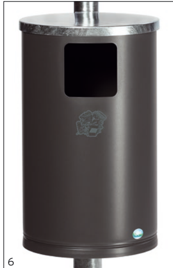
Abb.: WR 1, eisenglimmer, (ähnlich DB703), beschichtet, Art.-Nr. 14406