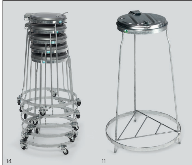
Photo : 5 x n° d'art. : 1026, MSTS 120, 1 x n° d'art. : 1028, MSTS 120 mobile, avec couvercles plastiques argents