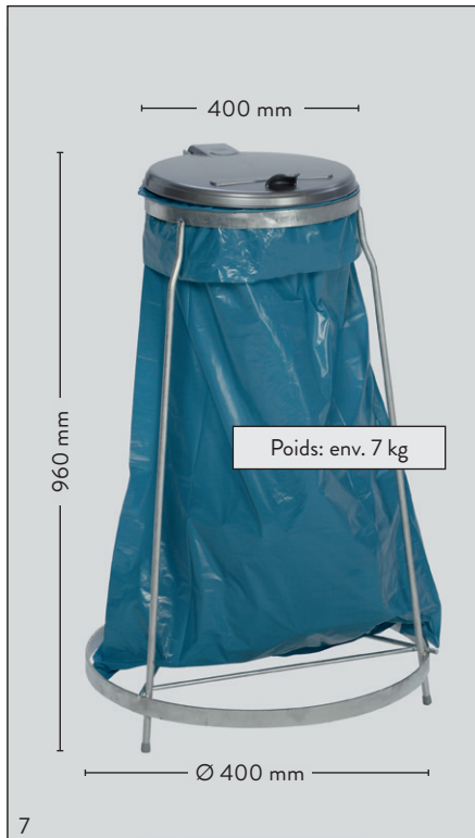
Photo : MSTS 120, avec couvercle plastique argent, n° d'art. : 1026