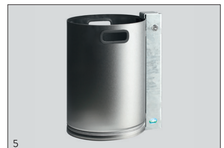
Abb.: WR 3, Art.-Nr. 1184

ACCESSOIRES: tube vertical galvanisé à chaud - pour encastrement dans le béton.