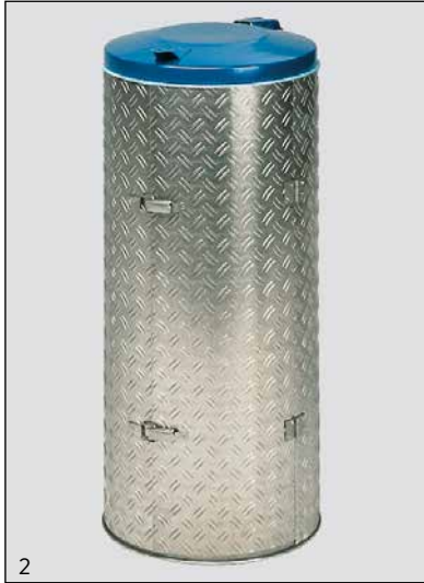
Appl.: N° d'art.: 1702, Couvercle INOX en bleu

Particulièrement appropriée pour une utilisation extérieure et dans les zones humides. Pour un sac de 120 l. Les matériaux utilisés pour la fabrication garantissent une durabilité et une optique avenante.