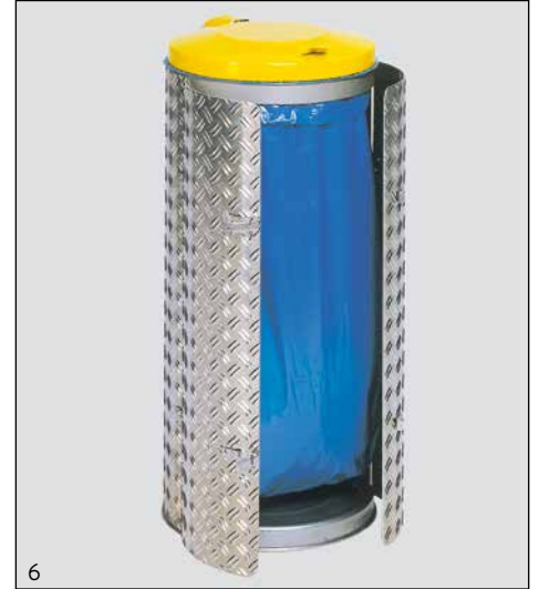
Appl.: N° d'art.: 1701, Couvercle INOX en jaune