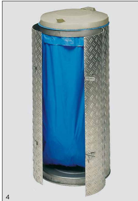
Appl.: N° d'art.: 1704, Couvercle INOX en gris

Fabriqué en INOX incl. couvercle inox avec un revêtement par poudre colorée. Le tôle d'enveloppe et des portes est traitée avec tôle alu strié.