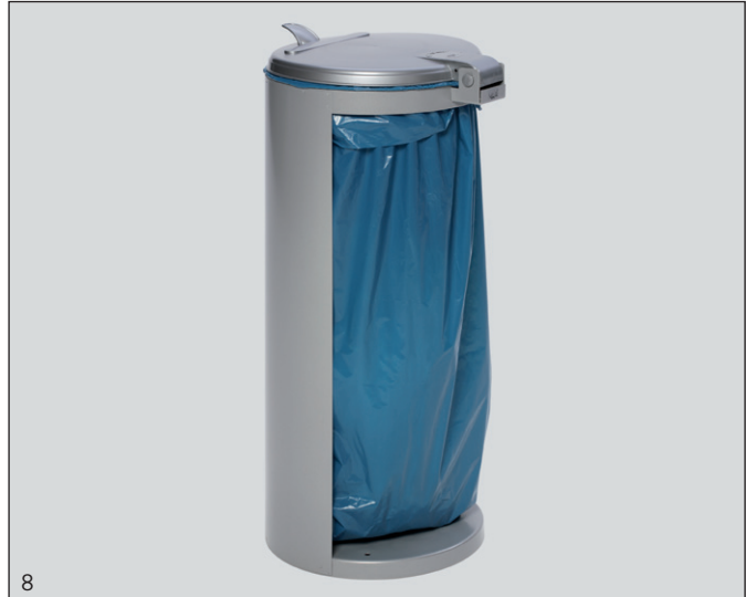
Photo: Poubelle compacte junior, revêtue argent ROTAX, no. d'art. 10012