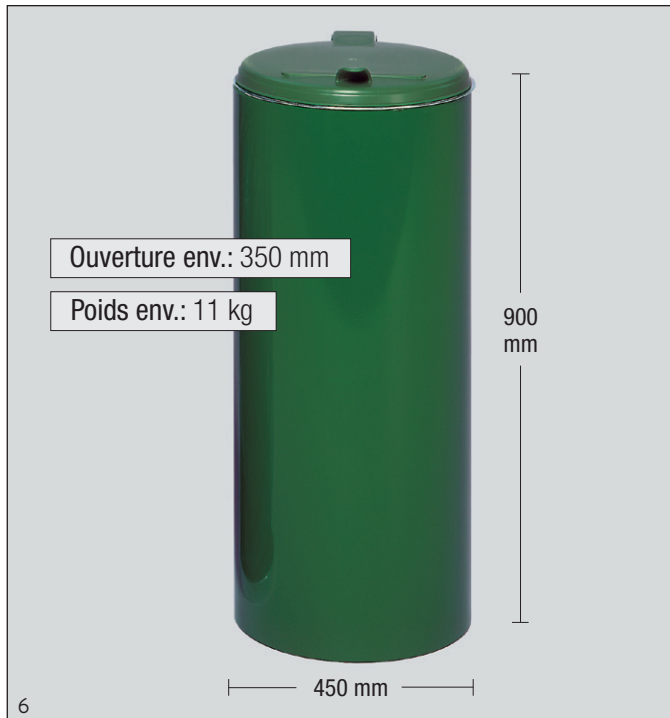
Photo: Poubelle compacte junior, revêtu vert, no. d'art. 1000

Livraison en emballage carton individuel.