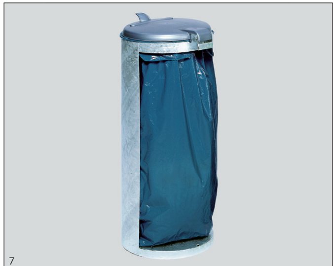
Photo: Poubelle compacte junior, galvanisée, no. d'art. 1001