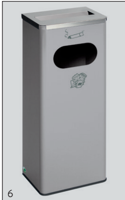
Abb.: Art.-Nr. 28733