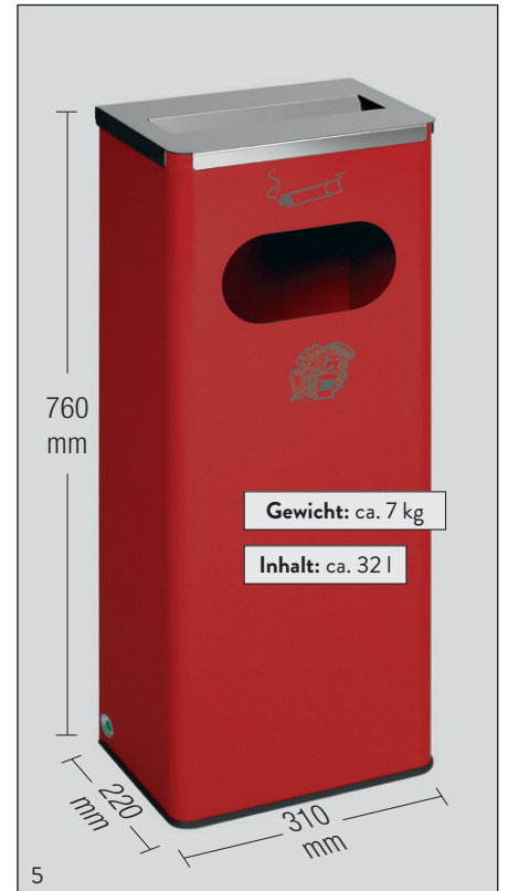
Abb.: Art.-Nr. 28731