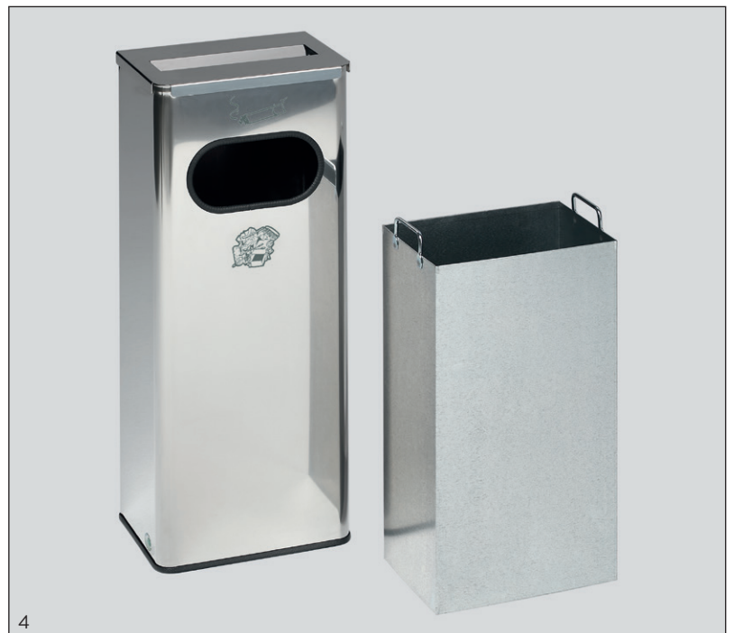
Abb.: Art.-Nr. 28738 und 28739