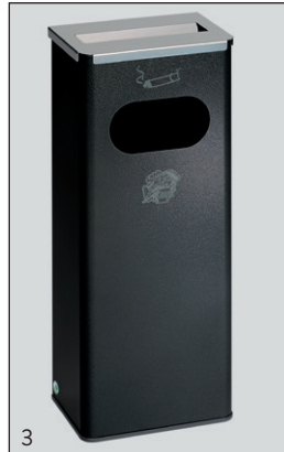
Abb.: Art.-Nr. 28730