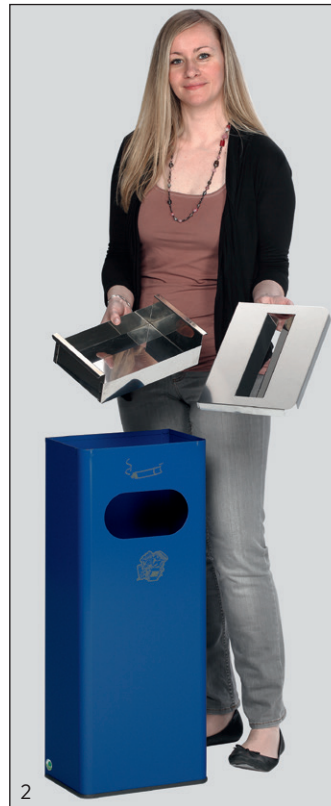
Abb.: Art.-Nr. 28732

Gerätekorpus aus elektrolytisch verzinkten Stahlteilen gefertigt. Für einen dauerhaften Korrosionsschutz mit einer Pulverbeschichtung (antik-silber = Strukturbeschichtung) auf Polyester-Basis. Alternativ Gerätekorpus aus Edelstahl, poliert. Ausgerüstet sind die Geräte mit einem Ascher, einer Abdeckung aus Edelstahl, poliert und bodenschonendem Kantenschutz. Lieferung inkl. Piktogramm-aufklebern. Als Zubehör ist ein Inneneinsatz aus verzinktem Stahlblech mit praktischen Bügelgriffen lieferbar. Inkl. Montagemat. zur Wandmontage.