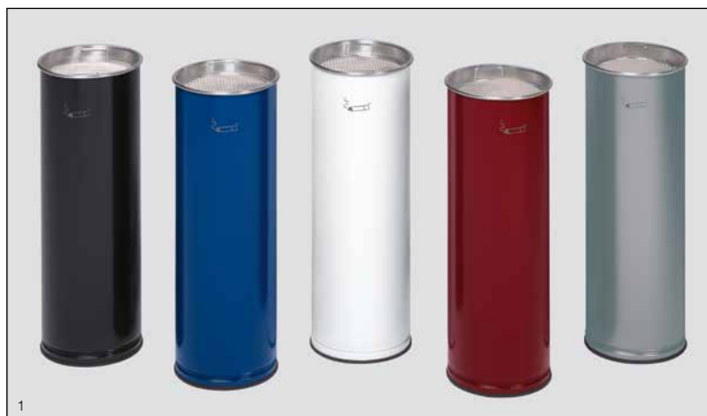
Photo: Palette de coloris modèle H 66

Le cendrier H 66 est idéal pour zones de fumeurs.