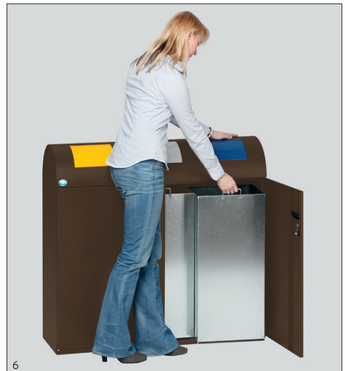
6 Appl.: N° d'article 21202