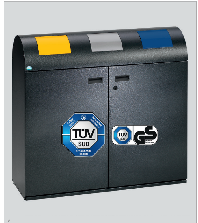
2 Appl.: N° d'article 21200

Accessoire: KIT roues, 5 roulettes pivotantes (2 avec frein) N° d'article 21209