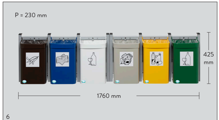
Photo : 2 x station triple G 3, 1 x n° d'art. 1546 et 1 x n° d'art. 1541